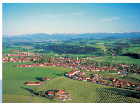
Lokale Aktionsgruppe Regionalentwicklung Oberallgäu

Regionales Entwicklungskonzept 2007–2013