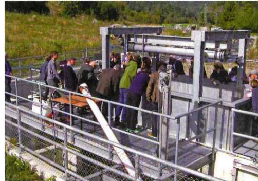
Die Exkursionsteilnehmer informieren sich über die Fischzählstation.