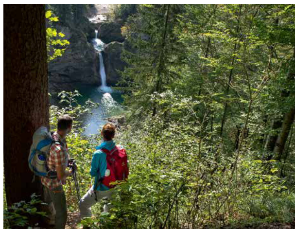
Sonnenaufgang mit viel Stimmung vom Hochgrat – links im Bild der markante Hochvogel; die Buchenegger Wasserfälle liegen auf Oberstaufener Gebiet.

Ludwig II. oder über die Moore als Relikte der einstigen Gletscher. Wir haben uns für die Himmelsstürmer-Route über die Gipfel hinweg entschieden und sind zwischen Oberstaufen, Ofterschwang und Fischen im Oberallgäu unterwegs, im Trilogieraum der „Alpgärten“.