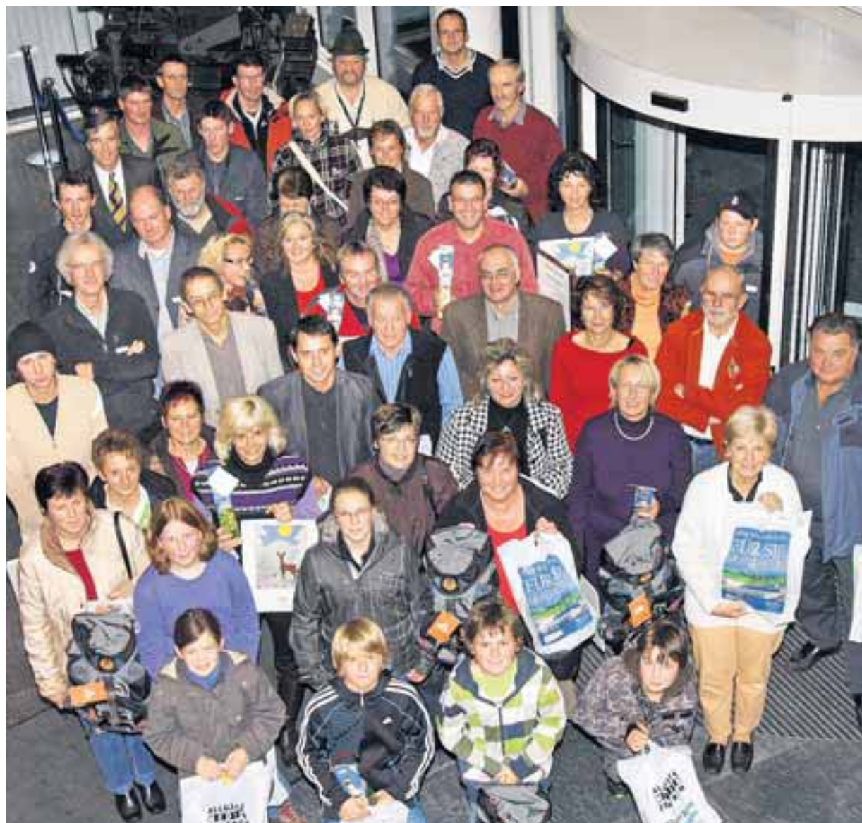
Jung und Alt hatten bei der diesjährigen Sommer-Aktion mitgemacht. 48 Preise wurden im Allgäuer Medienzentrum an die Teilnehmer überreicht.

Zudem warteten Meckatzer Wanderrucksäcke, Freifahrten mit dem Alpsee-Coaster, Eintrittskarten für einen Kletterwald, ein Rucksack und ein Schlafsack von Haglöfs auf die Gewinner. Die vier Hauptpreise: Eine Zugspitztour mit den Hydroalpin-Bergführern, eine Kanarenreise mit Top Mountain Tours, ein Familienurlaub auf dem Meckatzer-Haus und eine Freeride-Woche in Chamonix mit Haglöfs. Die im Verein Allgäuer Alpgenuss zusammengeschlossenen Alpen – insgesamt 39 im Allgäu – haben sich verpflichtet, Gästen ausschließlich selbst gefertigte Produkte oder solche aus unmittelbarer regionaler Herkunft anzubieten. Damit soll die Wertschöpfung in der Region bleiben und Gäste auf den Alpen sollen ursprüngliche Allgäuer Produkte kennenlernen. Auch im kommenden Sommer soll es wieder eine Aktion unserer Zeitung geben.