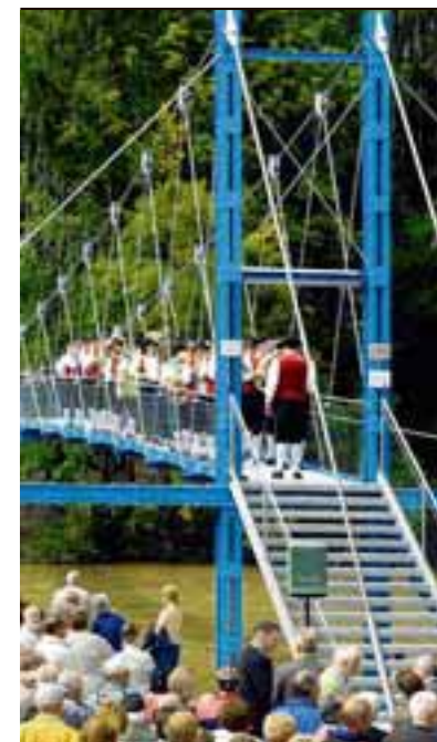
Hingucker: Die Hängebrücke über die Iller zwischen Altusried und Dietmannsried.