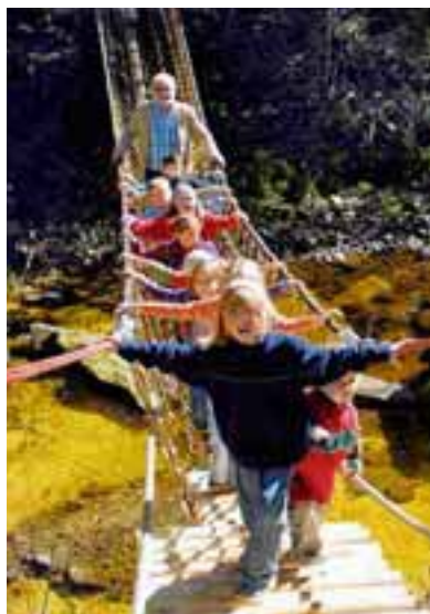
Spaziergang: Der Wasserweg entlang der Durach lockt Familien an.