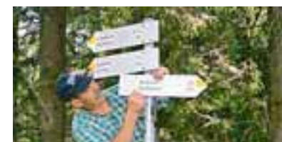
Einheit: Nicht nur in Betzigau, im ganzen Oberallgäu gibt es nun gleich aussehende Wanderwegweiser.