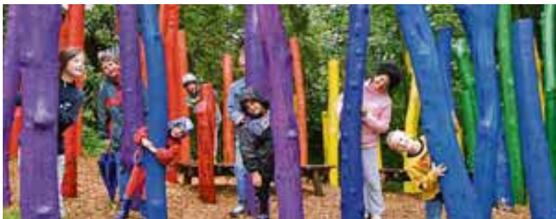
Versteckspiel: Ein Abenteuer-Spielplatz für alle Kinder entstand auf dem Gelände der Reha-Klinik in Mittelberg (Gemeinde Oy-Mittelberg) und nennt sich „Park der Sinne“.