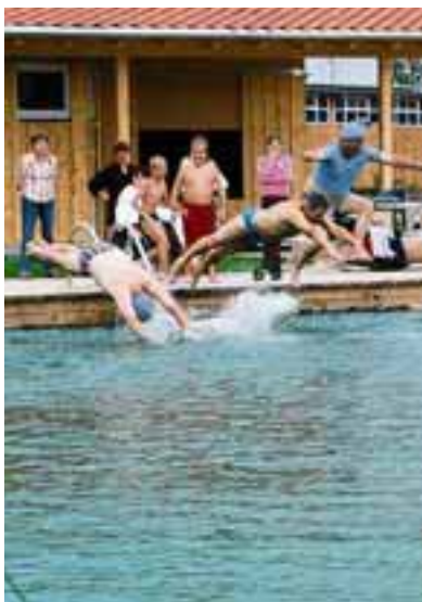
Kopfsprung: Einen Schwimmteich gibt's bei den Wasserlandschaften in Wildpoldsried.