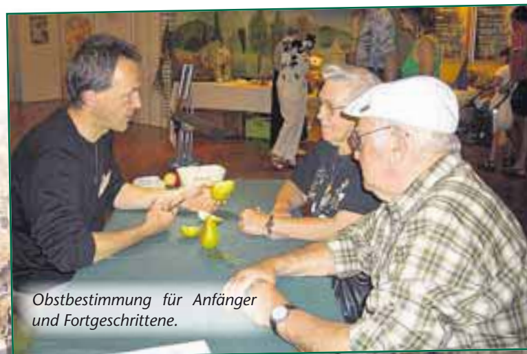
Obstbestimmung für Anfänger und Fortgeschrittene.