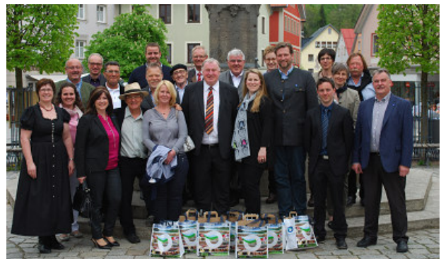
Die Delegation aus Belgien mit vielen Akteuren aus dem Oberallgäu auf Erkundungsreise in der Region.