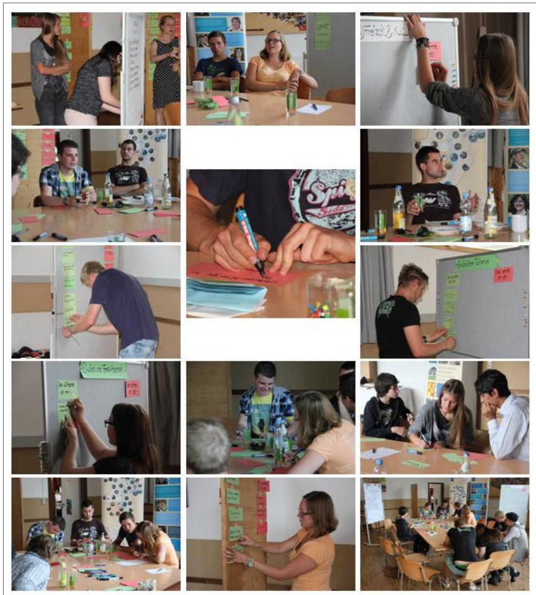
Jugendworkshop in Kempten