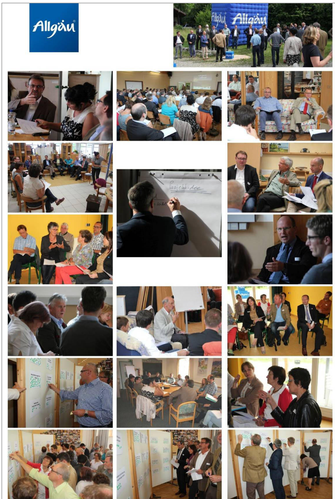
Allgäuerwerkstatt in Kempten