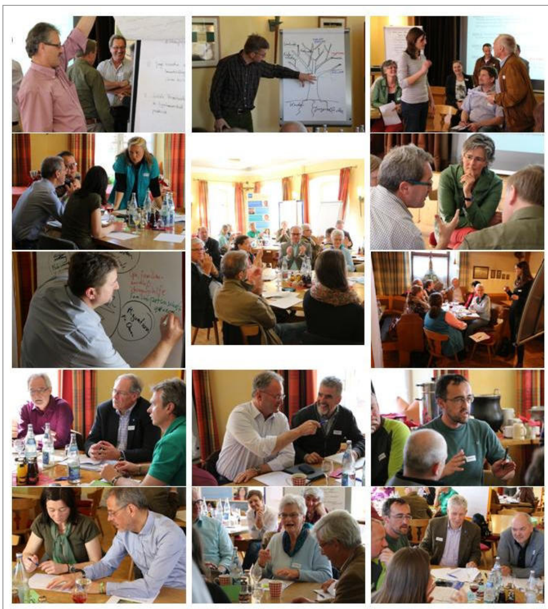
Bilanz- und Perspektivkonferenz in Martinszell

Über das Engagement so vieler Menschen aus der Region haben wir uns sehr gefreut und hoffen, dass sie auch bei der Umsetzung der Strategie so aktiv dabei sind!