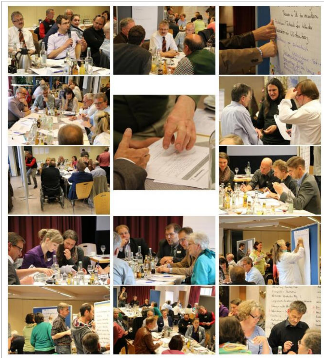
Ideenworkshop in Immenstadt-Stein